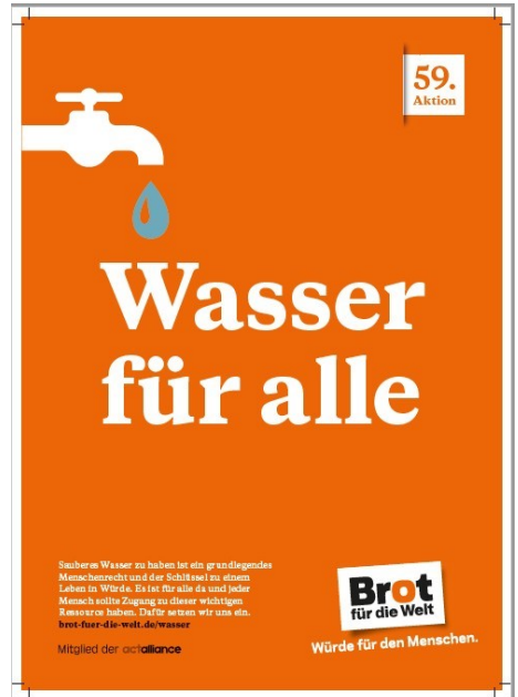
Das Plakat von Brot für die Welt aus dem gleichen Jahr.

Die Redaktion wird Sie im nächsten Gemeindebrief und hier auf den Seite der Gemeinde weiter informieren, wie es mit „unseren Pauls“ weiter gegangen ist.